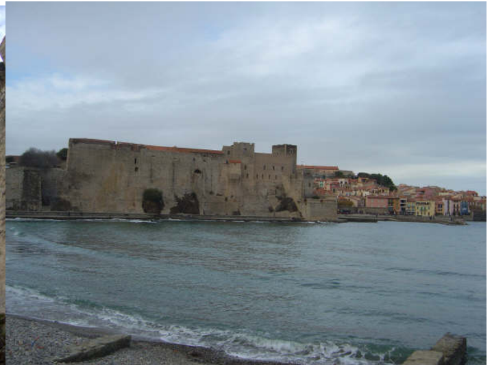
Parte de la fortaleza de los Templarios en Collioure (Rosellón), del siglo XII, que llegó a ser residencia de verano de los reyes de Mallorca (1226-1344). En este precioso pueblo de Collioure está la tumba del gran poeta español Antonio Machado.