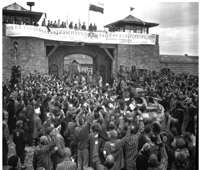
Campo de Exterminio de Mautthausen-Gusen

En el Campo de Exterminio del Mautthausen , compuesto por varios subcampos, fueron internados más de 9.000 españoles, siendo asesinados cerca de 5.500, la mayoría procedentes del campo de internamiento o de