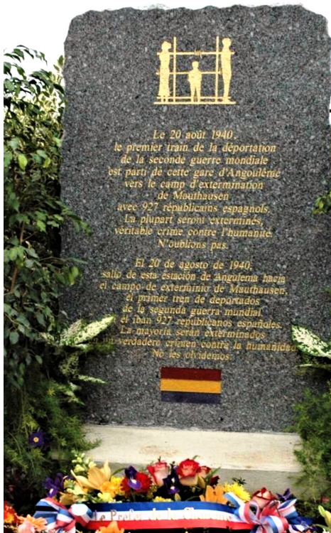
Monumento a la memoria de los 927 republicanos españoles que partieron desde la estación de Angulema a los campos de exterminio nazis.

Consiguió pasar a Francia donde fueron confinados en Les Alliers , cerca de Angulema, cientos de hombres, mujeres y niños hasta el 20 de agosto de 1940, cuando la Gestapo (SS) y soldados de la Wehrmacht nazi lo metieron en un tren en la estación de Angulema con vagones de ganado, junto a otros 926 españoles (Convoy de los 927). Después de cuatro días en tren en condiciones infrahumanas llegaron a Mauthausen